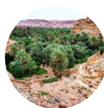
Valle De Dades